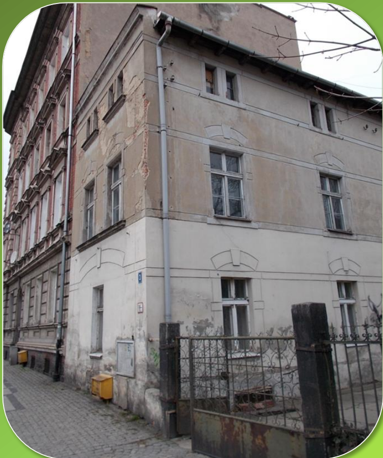
1 Maja 3